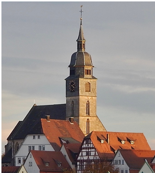
cc qwesey qwesey