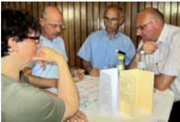
Sitzung des Dekanatsrats, Mai 2011