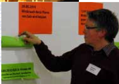
Freitagsgebet um Erneuerung der Kirche und Dialog-Forum, Januar 2011