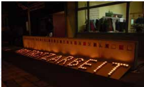
Neujahrsempfang der Betriebsseelsorge, Januar 2011