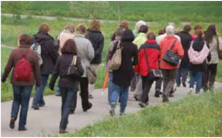
Pfarramtssekretärinnen unterwegs auf dem Martinusweg, Mai 2011